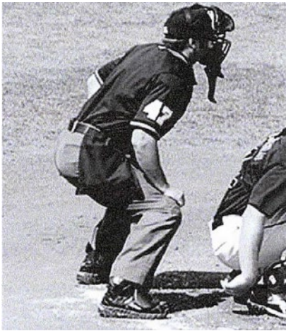
(ロットポジション) (スロットスタンス)