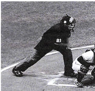
(センターポジション) (ニーズスタンス)